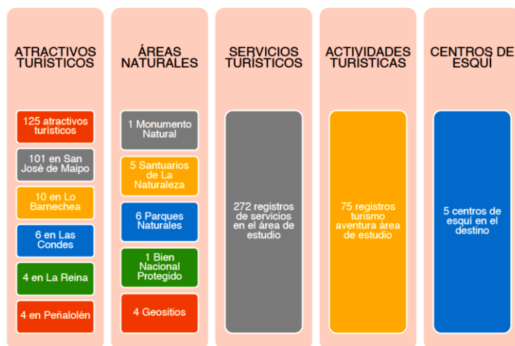
Imagen N° 3. Oferta turística en el territorio de la Región Metropolitana y su área de influencia